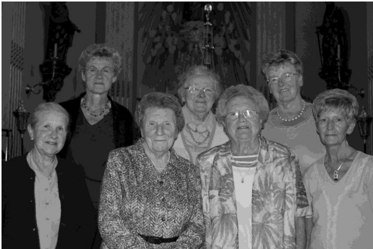
Het kerkkoor van Hansbeke.