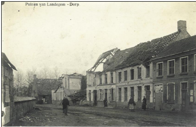
Het dorp van Landegem na de beschietingen in oktober 1918.