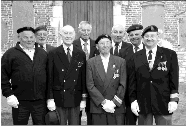
De afvaardiging van NSB Nevele bij de hulding aan het Nevels oorlogsmonument.