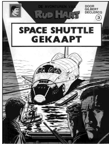
Kaft van de strip Space shuttle gekaapt, uitgegeven bij N.V. De Vlijt, Antwerpen, 1986.