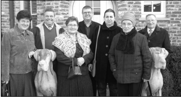
Kerzangkoor Sint-Eligius, Vosselare