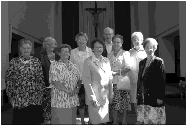
Het kerkkoor van Landegem.