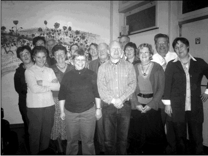
Het kerkzangkoor van Nevele in 2007.